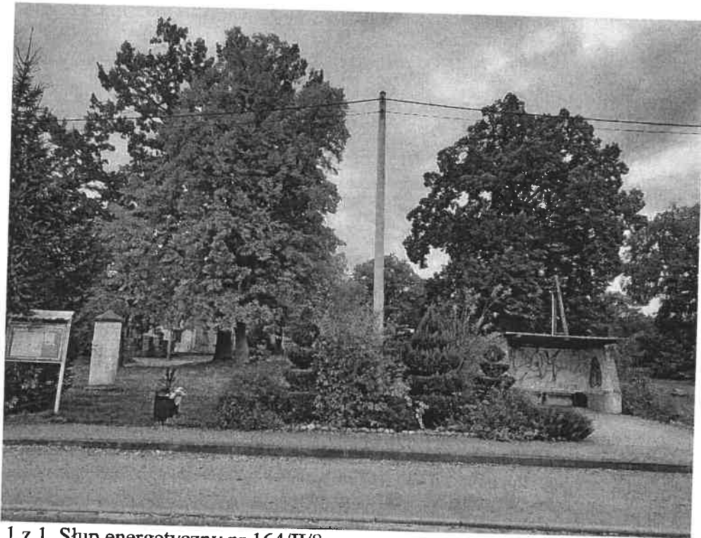
Zdjęcie 1 z 1. Słup energetyczny nr 164/II/8