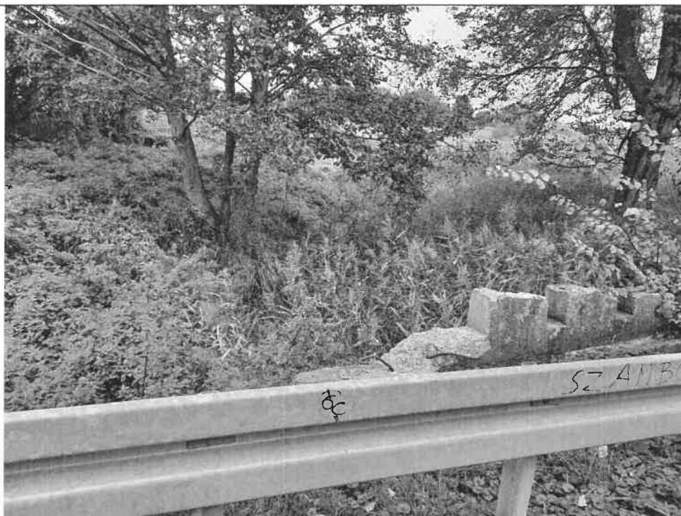
Zdjęcie 1 - 2. Widok całkowicie niedrożnego cieku wodnego rzeczki Jabłonna(zdjęcia z dnia 20.10.2021).