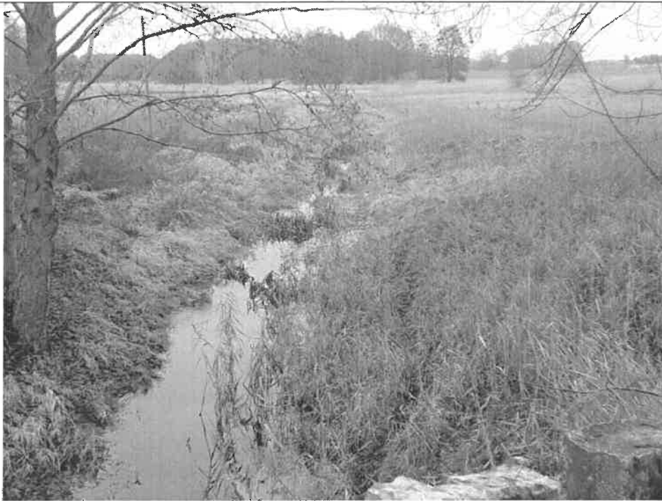
Zdjęcie nr 3. Widok rzeczki z dnia 10.03.2019r