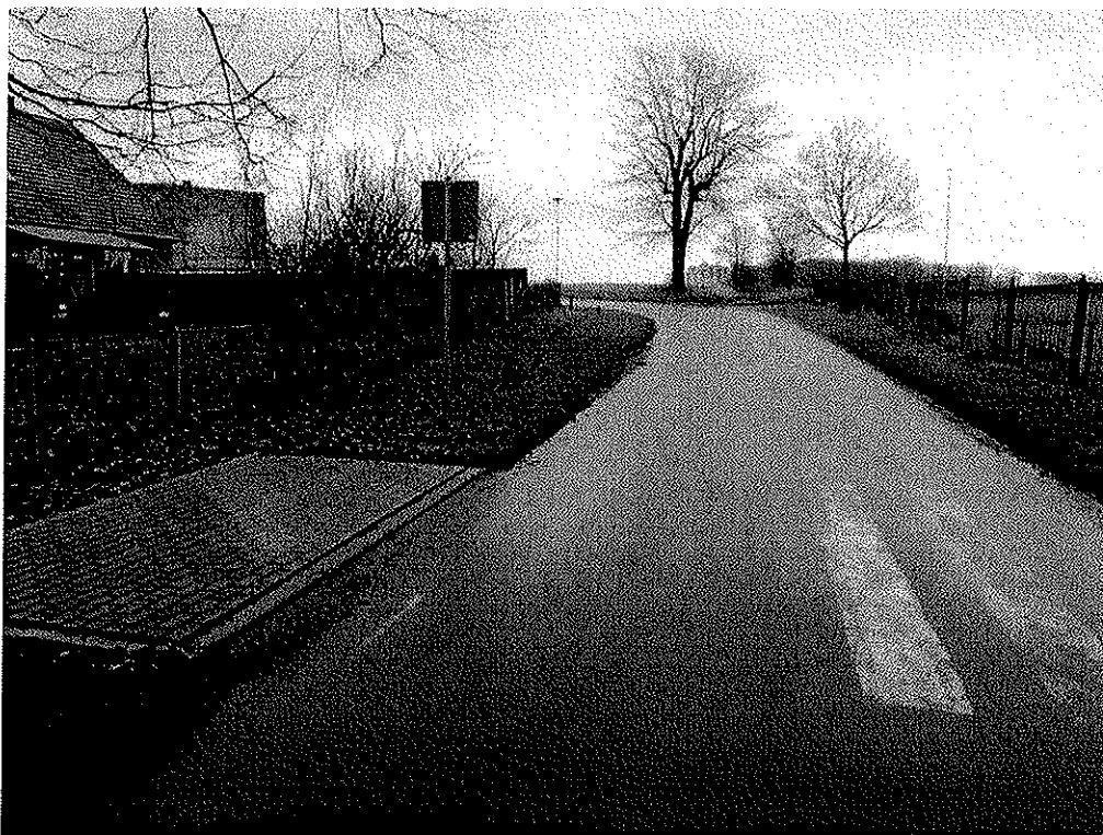
Zdjęcie nr 1. Widok pobocza od numeru 55 w kierunku miejscowości Kępsko. Kolejne zdjęcie do nr 4 przedstawiają widok pobocza do numeru 59.

Załącznik do wniosku nr 1/28.02.2019- Budowa chodnika od numeru 55 do 59.