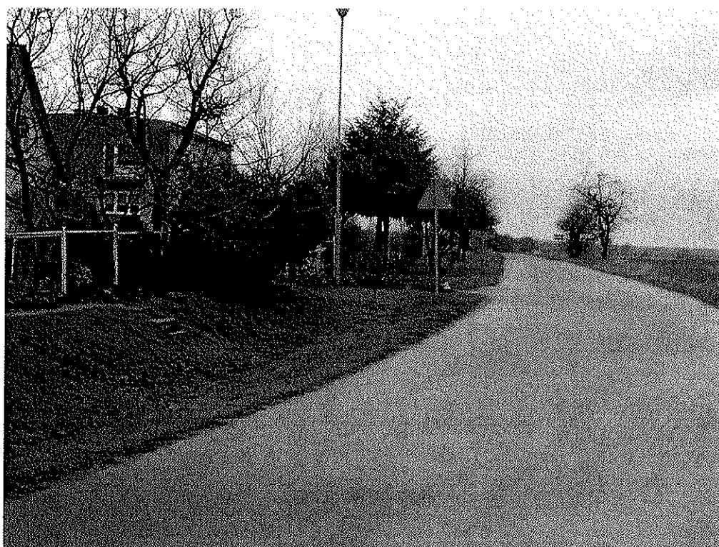
Zdjęcie nr 4.