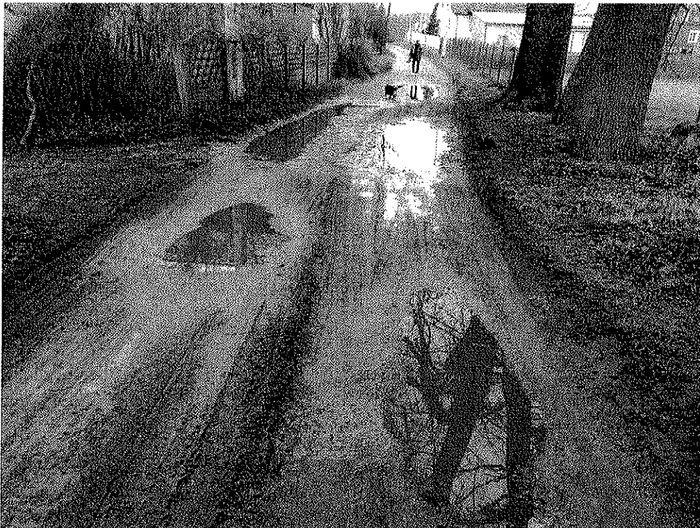
Zdjęcie nr 4.