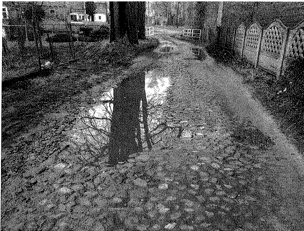
Zdjęcie nr 1. Widok drogi od strony budynku mieszkalnego nr 43

Załącznik do wniosku nr 2/28.02.2019- Remont odcinka drogi wewnętrznej miejscowości Niekarzyn.